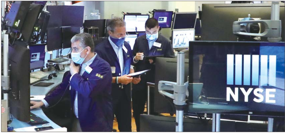
5月27日, 交易员戴着口罩在美国纽约证券交易所工作。