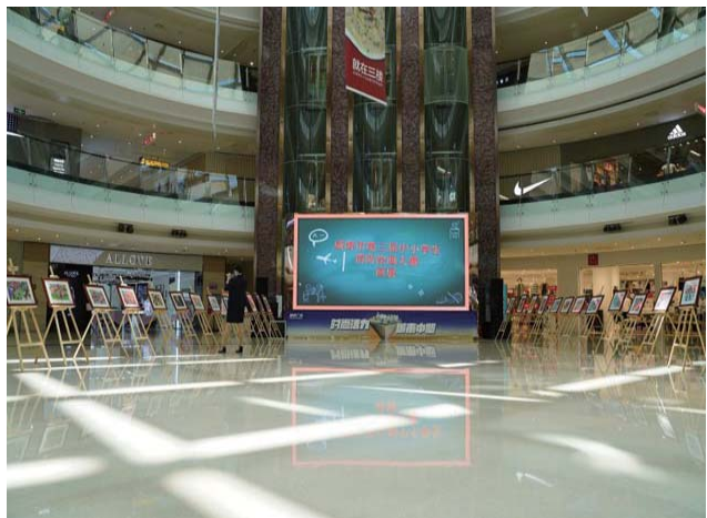
第三届“童心绘消防 安全伴成长”绘画大赛“云展览”。