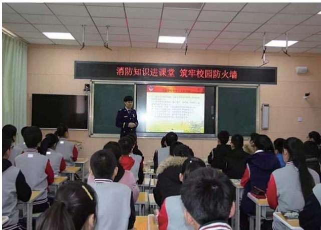
威海消防“消防知识进课堂”系列活动。