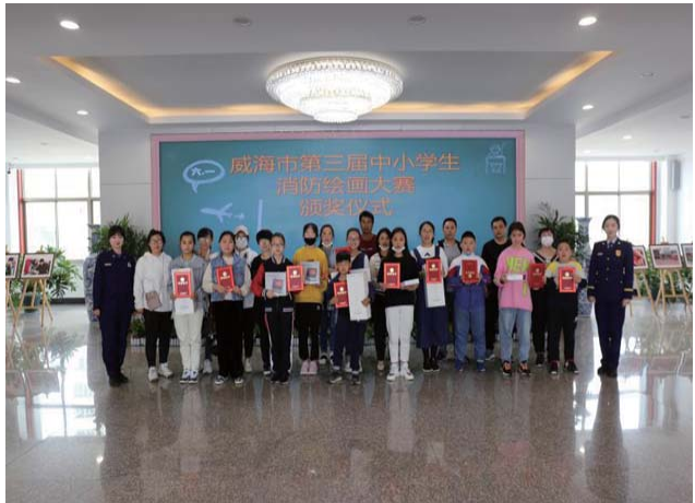
第三届“童心绘消防 安全伴成长”绘画大赛颁奖现场。