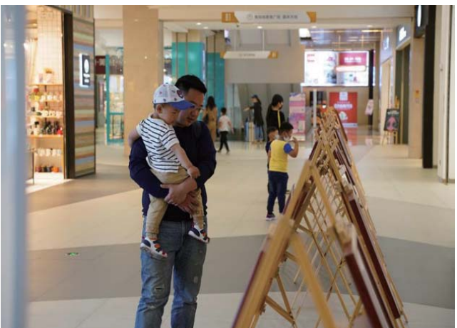
市民正在威高广场参观绘画大赛的作品。