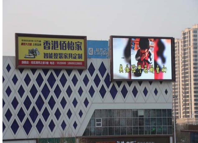
萌娃说消防，点亮威海城市大屏幕。