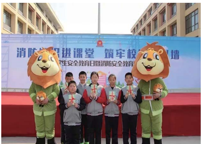
威海消防中小学生安全教育日主题活动。