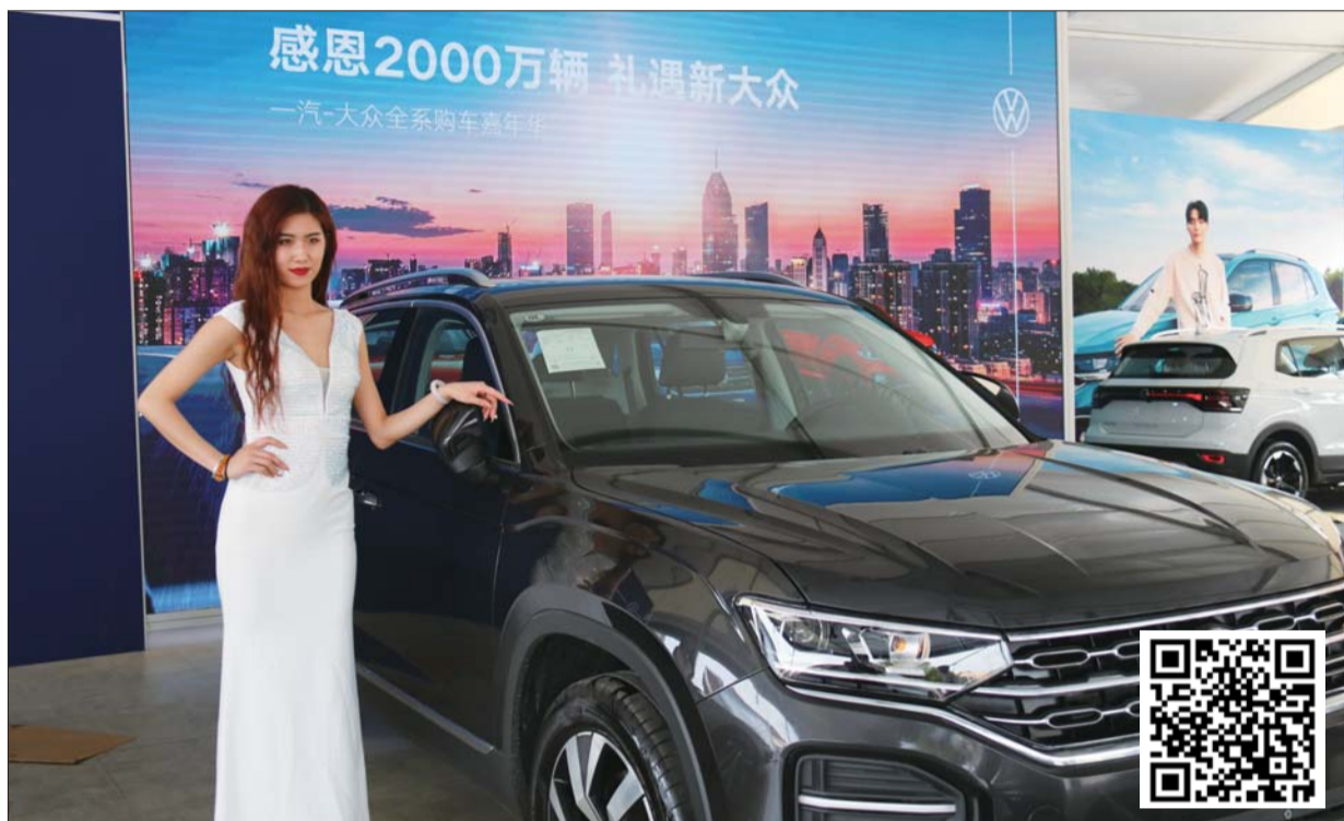
一汽-大众车模已就位。

6月5日,2020齐鲁(济宁)车展将在济宁体育中心(鸟巢)开幕,作为鲁南地区展示规模、影响力、辐射半径最大的车展,今年已经走过20个年头。“买车就到齐鲁车展”早已成为济宁人的共识。