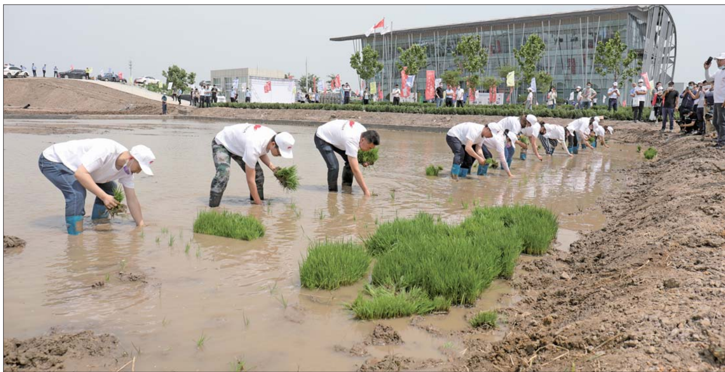
活动现场,工作人员正在试验田中插秧。