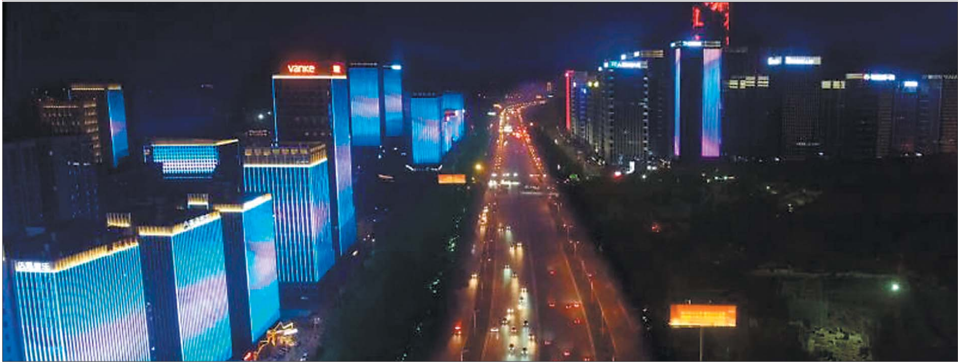
济南城管大力推进夜景亮化工程,让泉城的夜更加亮丽。