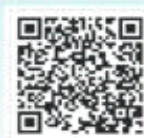
壹点问法律师 在线专题二维码

如果您有相关问题要问“壹点问法”的法律专家,可以下载“齐鲁壹点”APP,在首页点击“问壹点”中的“问法”,即可看到已经入驻的律师团队。点击律师名称后,可以看到每位律师的简介和专长,点击“向TA提问”即可留言。律师们收到系统提示之后,将会及时回答您的问题。当然,也欢迎您每周一齐鲁壹点“情报站”参与“壹点问法”的相关话题!