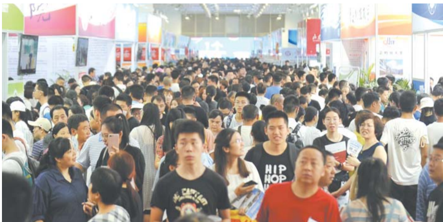
2019年,山东高考招生咨询会现场。(资料图)