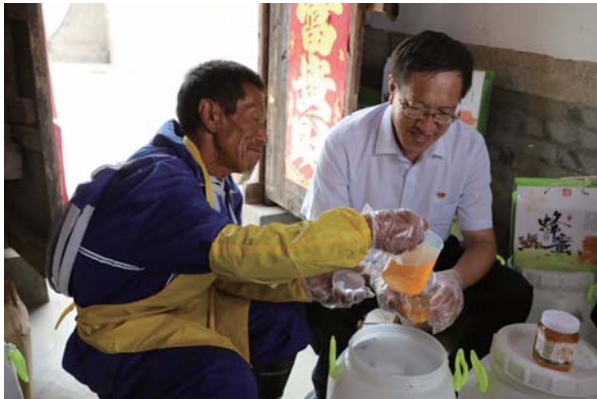
农行乳山市支行工作人员与村民共同装蜜