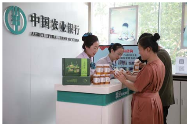
农行乳山市支行工作人员爱心扶贫购,助力蜂蜜销售