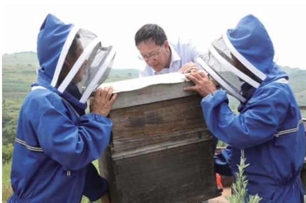
农行乳山市支行工作人员帮助村民搬运蜂箱