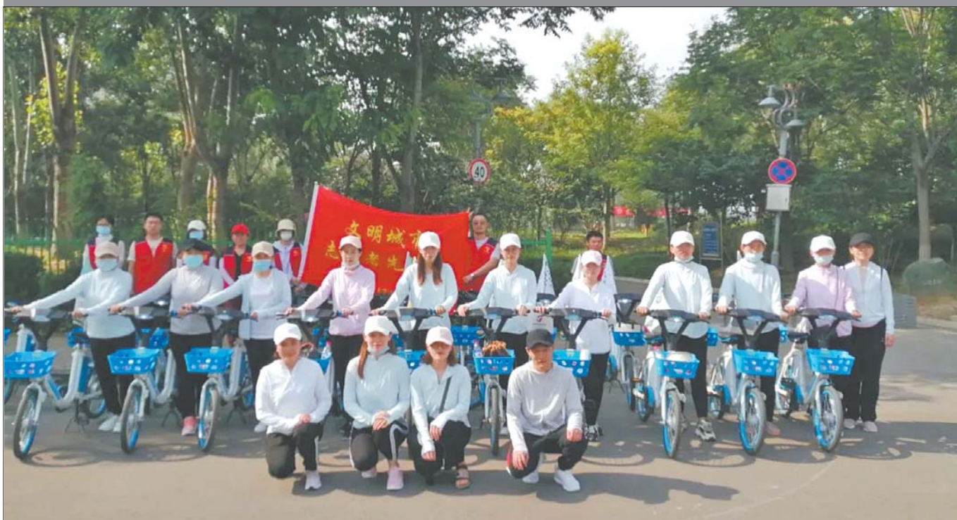
济阳区行政审批服务局“创建全国文明城市、争做文明济阳人”志愿服务先锋队授旗仪式在市民中心广场举行。