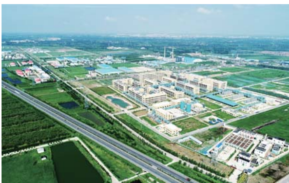
乐陵化工产业园全景。