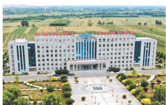
乐陵高新技术创业孵化基地。