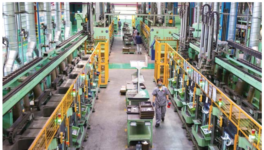
山东金麒麟股份有限公司生产车间。

如何在中国大区域战略中脱颖而出?怎样提升当地经济总量,拉伸龙头企业的产业链条,进而为优势产业、为区域经济注入新的动力和活力一直是乐陵历届主政者“千方百计破解的问题”。