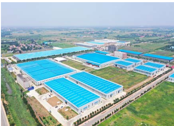
乐陵百源五金产业园。