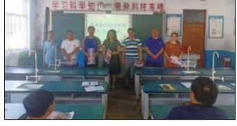
多管齐下,助力教学 为向高效率课堂要质量,做好线上与线下教学衔接,本学期,沂源县鲁村镇草埠中心完小采取多种措施,助力教学。(齐共云 赵福臻 周海玲)