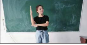
教师说课比赛 为加强岗位练兵,全面提升教师的专业技能,为教师搭建一个互相交流与展示的平台,近日,沂源县鲁村镇中心幼儿园举行了教师说课比赛活动。(齐爱山 周海玲)