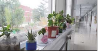
绿色窗台建设 为美化校园环境,增强学生环保意识,让学生体验管理花草的甘苦,本学期,沂源县鲁村镇中心小学开展了绿色窗台建设活动。(董其永 王艳艳)