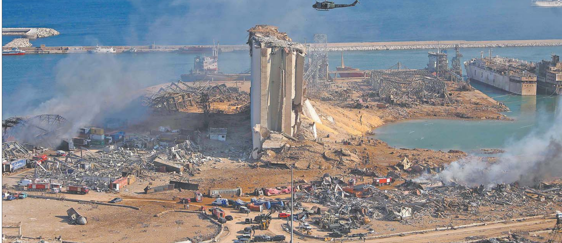
这是8月5日在贝鲁特拍摄的大爆炸核心区,包括损毁的大型储备粮粮仓(中)及其旁边爆炸造成的大坑。