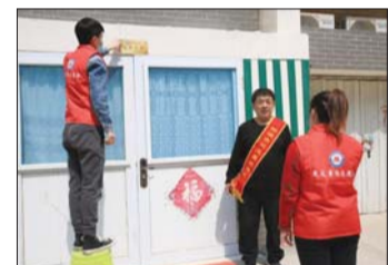
为见义勇为英模家庭挂“光荣牌”。

义涌水城,正气如歌。在见义勇为英雄们的感召下,在全社会对见义勇为事业的关心支持下,见义勇为这一中华民族传统美德已在聊城大地蔚然成风,注入这座城市的灵魂深处,成为文明聊城、和谐聊城、正义聊城的亮丽名片。