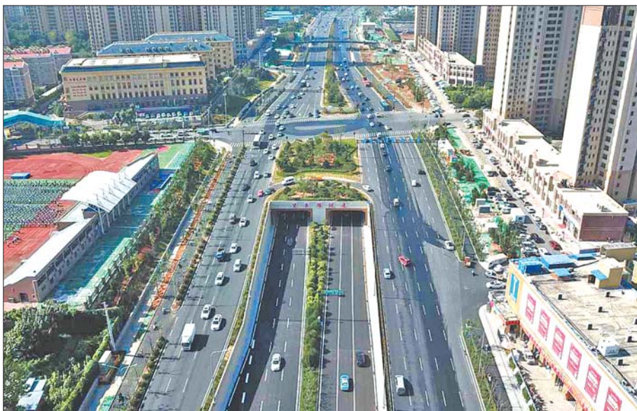
顺河高架第三期南延于9月1日通车,实现了“一桥飞架南北”,串起南山北水。

遵循适合和自愿原则设定专门区域,组织济南优秀工业制造和知名品牌企业展示,通过线下和线上相结合的方式,推动直播、创意设计、营销推广等新型服务业平台紧密合作,共同打造“济南制造天下共享”品牌。