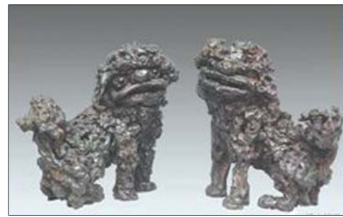
泰山“镇山三宝”之一的沉香狮子