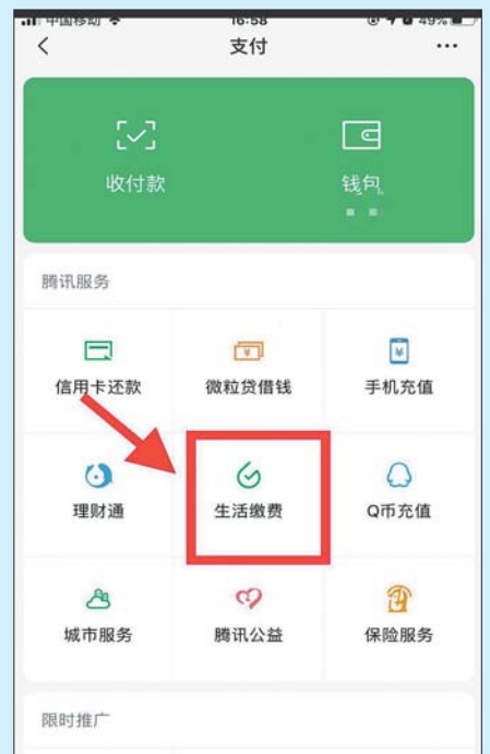
第二步 选择点击“生 活缴费”