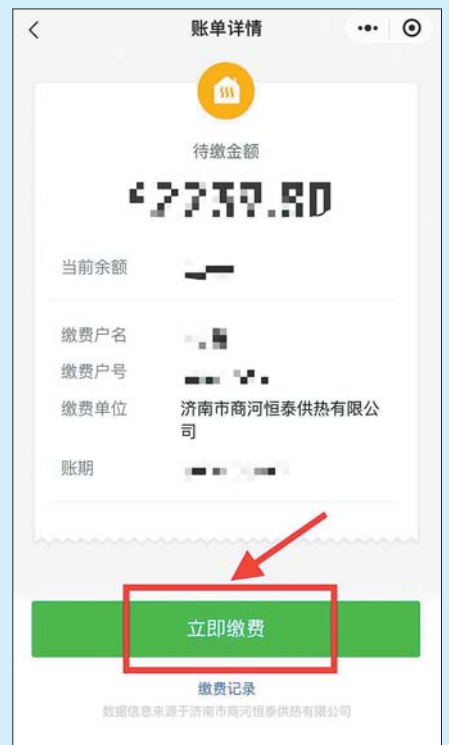
第六步 核对信息无误 后进行缴费