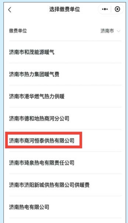
第四步 选择点击“济南市商 河恒泰供热有限公司”