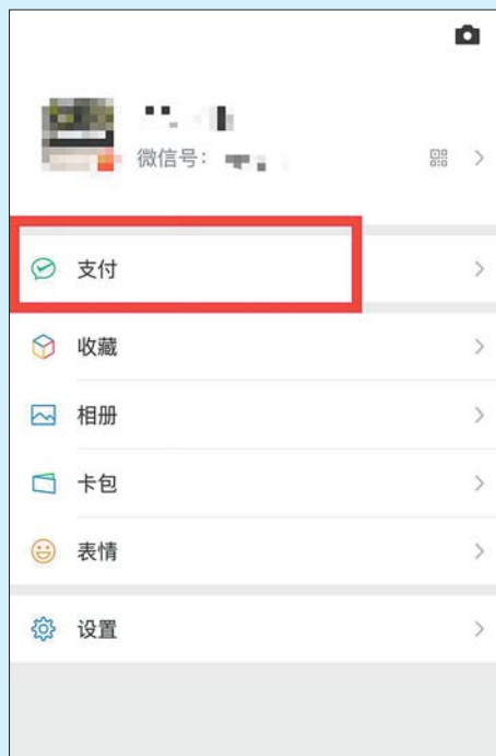
第一步 打开微信选择 点击“支付”

对于供暖缴费、报停等工作如有疑问,可前往济南市商河恒泰供热公司客户服务营业厅或直接拨打服务热线“0531-68782312”“0531-68782319”进行咨询。