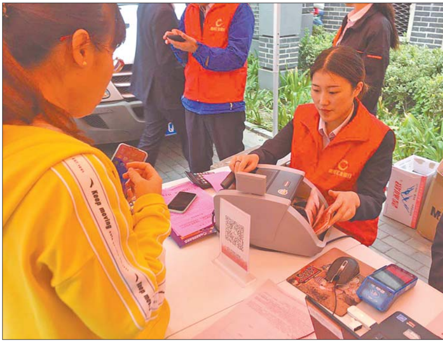
市民在活动期间现场完成缴费。

国庆长假,当大多数人都安排出行、旅游、探亲等活动时,在商河的大街小巷,有一群人“与众不同”,他们奋战坚守在工作一线,为了2020—2021年供暖季忙碌着。