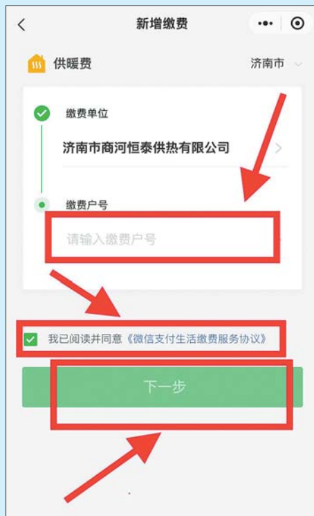
第五步 填写“缴费卡号”