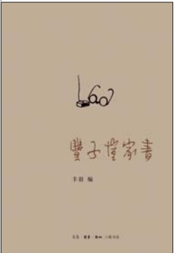
《丰子恺家书》 丰羽 编 生活·读书·新知三联书店