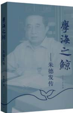
《学海之鲸:朱德发传》 赵德发 著 山东人民出版社

著名教育家、文学史家朱德发先生长期致力于中国现当代文学教学与研究,尤以五四文学、传统文学与现代文学关系的研究见长。他治学严谨,成果丰硕;教书育人,桃李满天。在应邀撰写的传记《学海之鲸:朱德发传》中,作家赵德发从传主的童年开始叙述,沿着其一生的轨迹,鲜活地还原了这位中国现代文学研究名家一步步成就为游行无畏、体态优雅、泽被众人的学海之鲸的生命历程。作者流注于字里行间的历史感喟和心灵对话,使这部传记作品具备了较为厚重的艺术和思想含量。