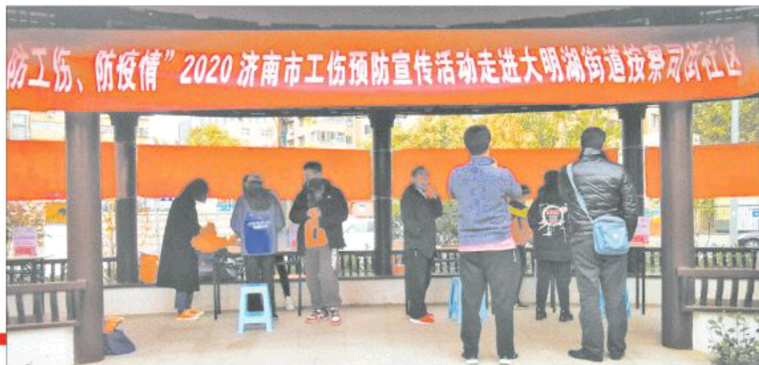
11月5日,2020年济南市工伤预防宣传活动走进大明湖街道按察司街社区

少企业经济损失,促进企业稳步健康发展的重要手段。据记者了解,济南市人社局今年也通过各种形式重点对尘肺病、建筑施工、交通运输物流、机械制造加工等六大行业开展了工伤预防宣传工作,以加强市民对职业危险防范的意识。