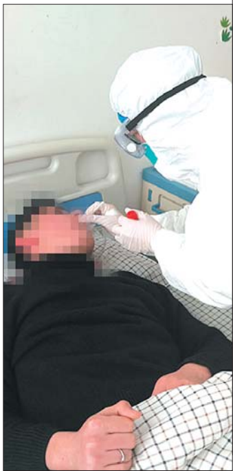
有一种高风险叫“20厘米接触”

如今,新冠肺炎疫情防控已经进入常态化阶段,生活生产秩序逐渐步入正轨。战“疫”期间,海阳市人民医院这座稳健有力的生命“压舱石”,为海阳扛起了什么?让我们来回看一下这个令人荡气回肠的战“疫”时刻。