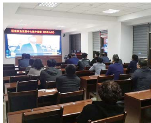
图为11月5日，区纪委监委专项监督检查组对区畜牧业发展中心集中收看《问政山东》会议纪律进行抽查。

注：现场巡察时间：11月1日至12月15日；联系电话接听时间：现场巡察期间工作日上午8:30至12:00、下午13:30至20:00；群众来信可直接投放至意见箱，也可邮寄至区委各巡察组邮政地址，收件人：区委第一(二、三)巡察组，邮政地址：威海市文登区文山路30号。