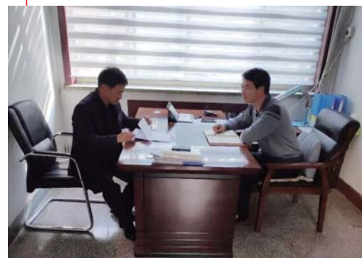
图为11月4日，区纪委监委派驻第二纪检监察组到区人大办督导作风大改进行动落实情况。