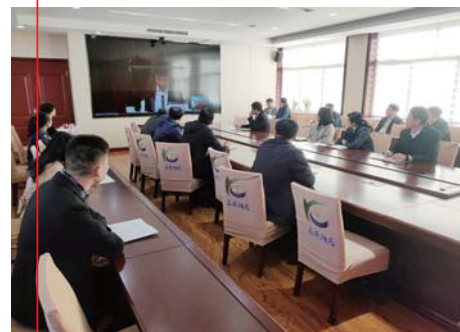
图为11月3日，区纪委监委机关组织收看作风大改进行动推进会实况。

11月3日，区纪委监委组织收看全市干部作风大改进行动推进会，第一时间对委机关作风大改进行动进行安排部署。在深入查摆解决自身存在的作风问题的同时，对各级各部门作风大改进行动开展情况进行专项监督检查，努力推动形成真抓实干的良好开局。