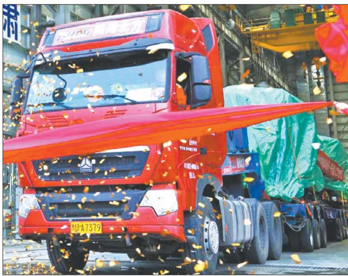
火箭运载车“撞彩”后驶出海阳港。

本报烟台11月23日讯(记者李顺高 通讯员 侯俊南 宫钦钊) 22日清晨6点50分,运载着东方航天港总装首发火箭——长征十一号遥九火箭的车子缓缓驶出海阳港,正式拉开了在山东生产火箭的序幕。