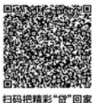
扫码把精彩“贷”回家