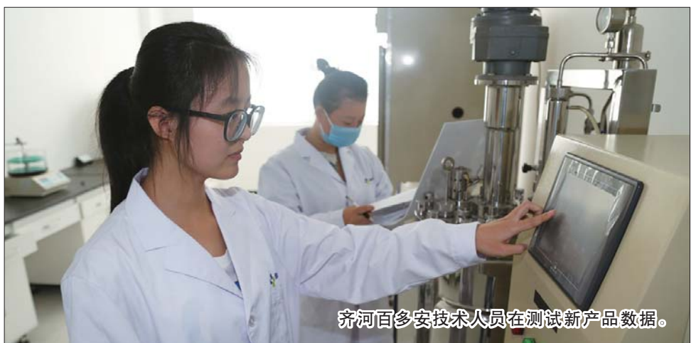
齐河百多安技术人员在测试新产品数据。