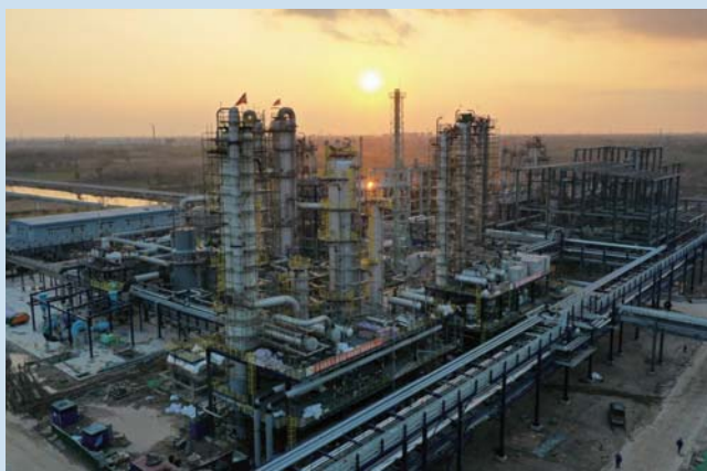
即将投产的山东凯瑞英材料科技有限公司