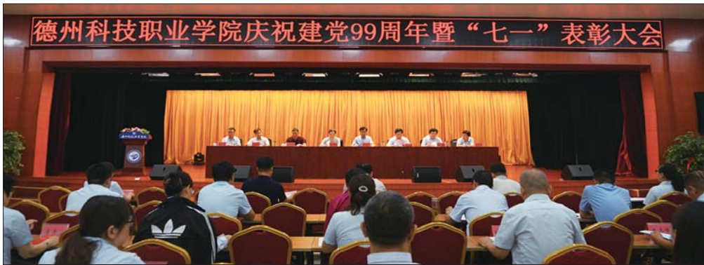
德州科技职业学院庆祝建党99周年暨“七一”表彰大会

2020年1月,全国首个“部省共建国家职业教育创新发展高地”启动,《教育部 山东省人民政府关于整省推进提质培优建设职业教育创新发展高地的意见》出台,拉开打造职教高地的序幕,也吹响了德州科技职业实施改革创新、提升人才培养质量、争创高职本科院校的号角。一年来,德州科技职业学院党委高度重视党的建设,加强党的领导,坚持以党建为引领,充分发挥党委在学院创新发展中的示范带头作用,为加快职教高地建设提供坚强政治保证。