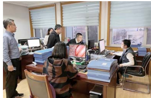
图 为 11月16日，派驻第一纪检监察组到区水利局督导干部作风大改进工作。