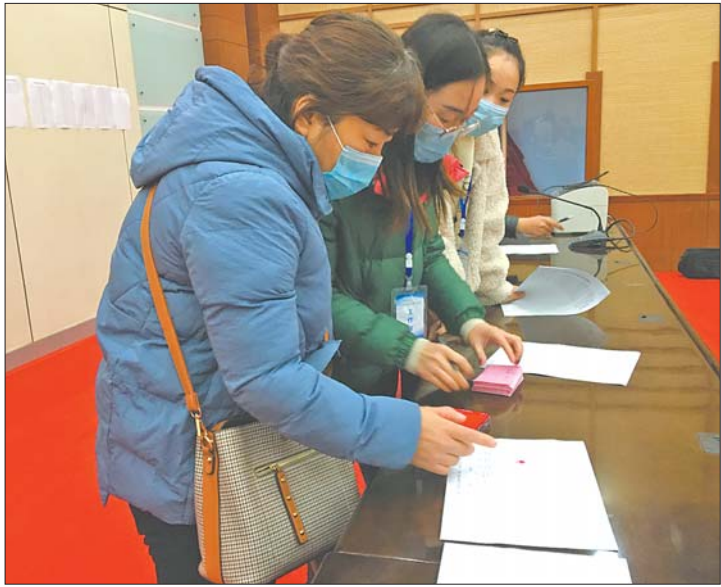
王颖选到自己心仪的房子。

记者在选房现场看到,为做到公开、公平、公正,活动采用电脑自主摇号选房程序,并有公证人员现场监督。选房秩序井然,选