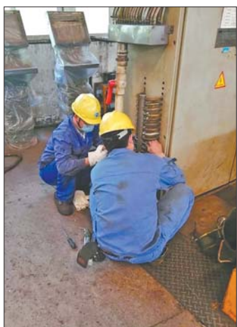
工作人员正在进行设备检修。

公司组织各部门认真学习防寒防冻措施,狠抓设备巡视和监督管理制度完善,制定冬季安全生产隐患排查步骤,确保生产设备安全稳定运行。持续加强能源环保管控,科学平衡各项能源介质消耗,密切监控环保设施运行,重点做好高能耗、高排放设备的环保监控工作。对跑冒滴漏、过度用热、不合理用能现象进行严格检查考核。进一步做好环保设施维护检查工作,规范精细操作,确保环保设施长周期稳定运行。对露天及室外设备、管道、水阀、消防栓等进行保温,确保阀门不冻堵,开展多轮次、多角度的防寒防冻自查整改工作,对自查中发现的问题及时整改,采取有效防范措施,狠抓设备巡检,对重要设备和重点区域加强