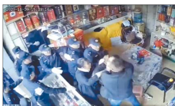
▲城管与商户冲突时的画面。