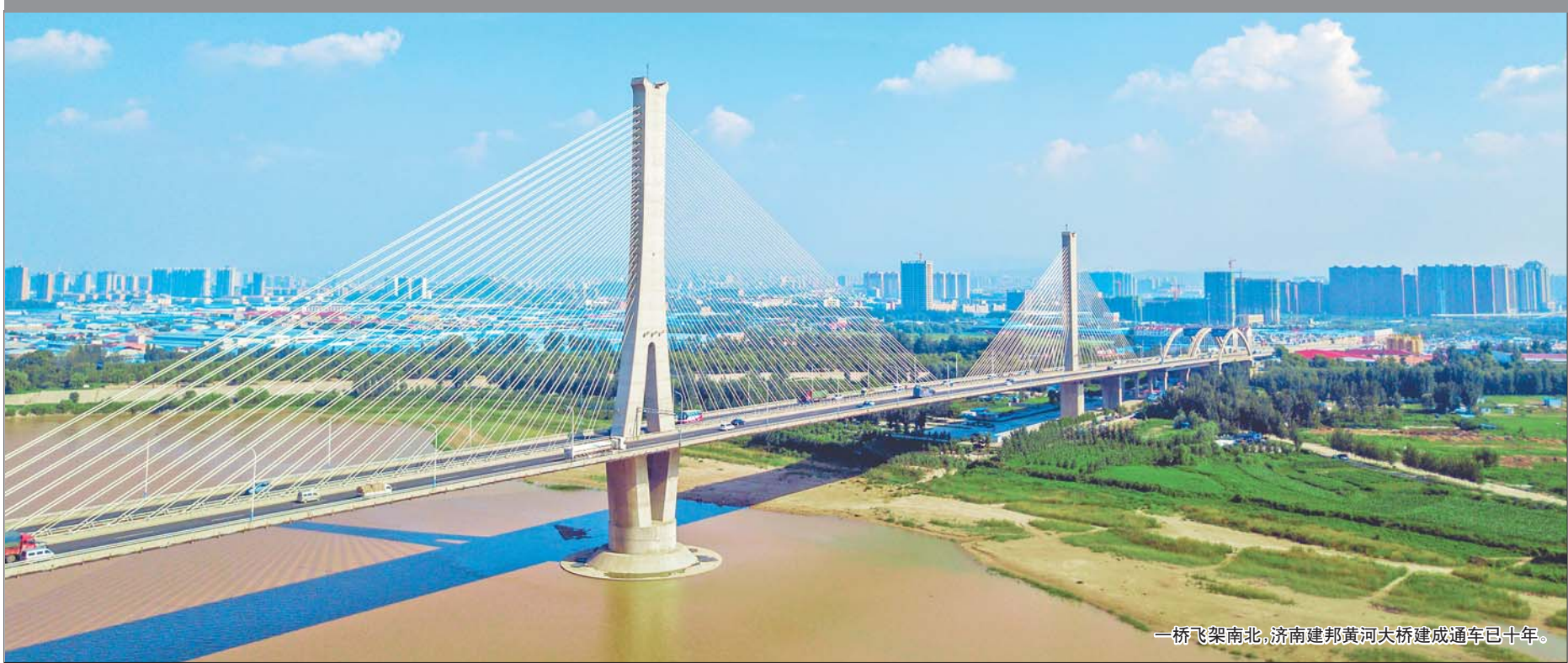
一桥飞架南北,济南建邦黄河大桥建成通车已十年。