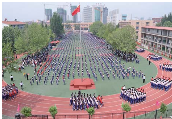
水发实验学校课间操实景