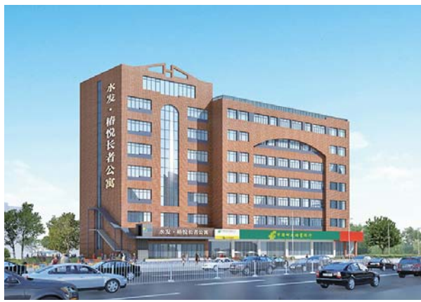
水发·椿悦长者公寓项目