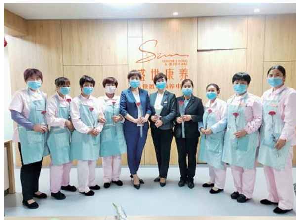
水发康养团队疫情在岗合影