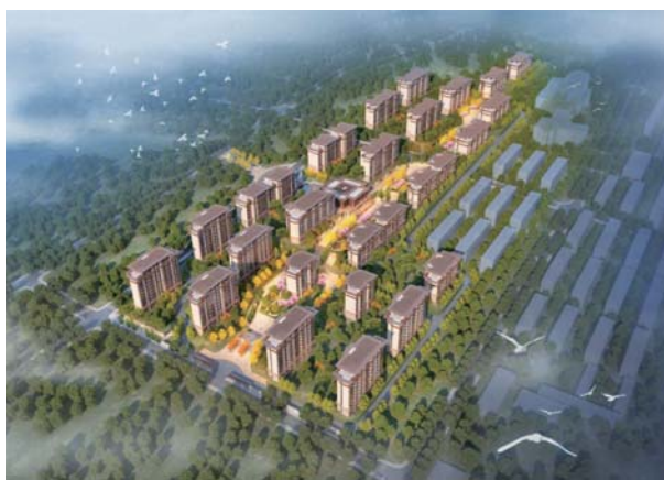
水发中昌·上和春天CCRC康养社区