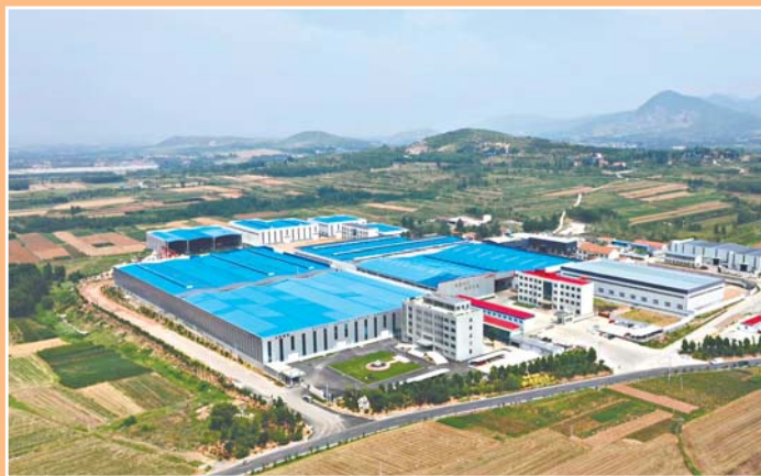
海东装备智造园区