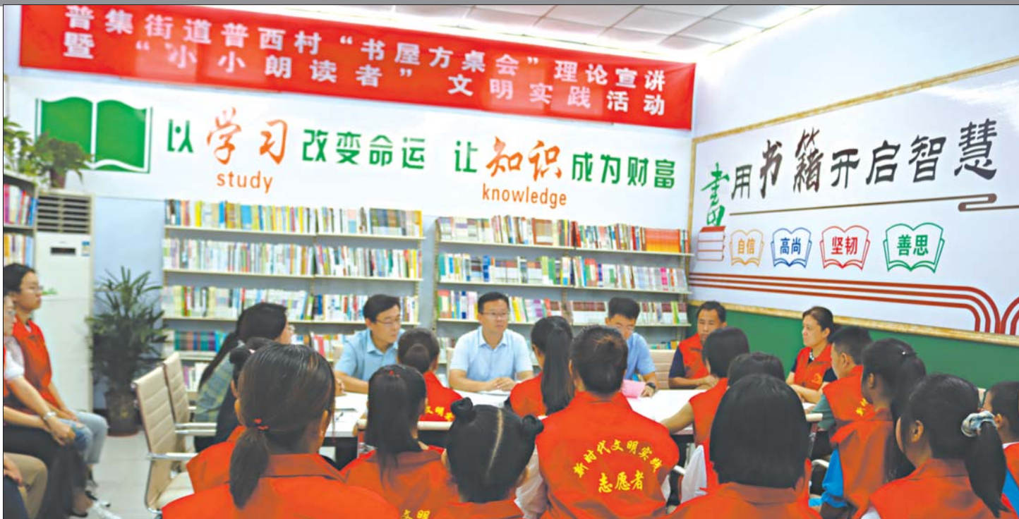
书屋方桌会暨“小小朗读者”文明实践活动

2020年,章丘区普集街道紧紧围绕全区“1266”工作布局,紧抓省会经济圈一体化和济南“东强”战略机遇、齐鲁智造大走廊和明水经济开发区东片区主战场发展契机,聚焦“1+253”工作思路,咬定建设“济南东方明珠”的目标不放松,抓实工业强办和乡村振兴两大主线,重点开展产业提升、精准扶贫、驻地提升、美丽乡村、文明创建五项攻坚行动,强化党的建设、安全稳定和民生事业三大保障,街道经济和社会各项事业实现了高质量发展。预计全年完成财政收入1.1亿元,首次突破亿元大关,同比增长12.3%。