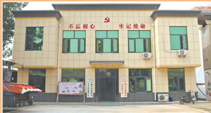
桥子村党群服务中心