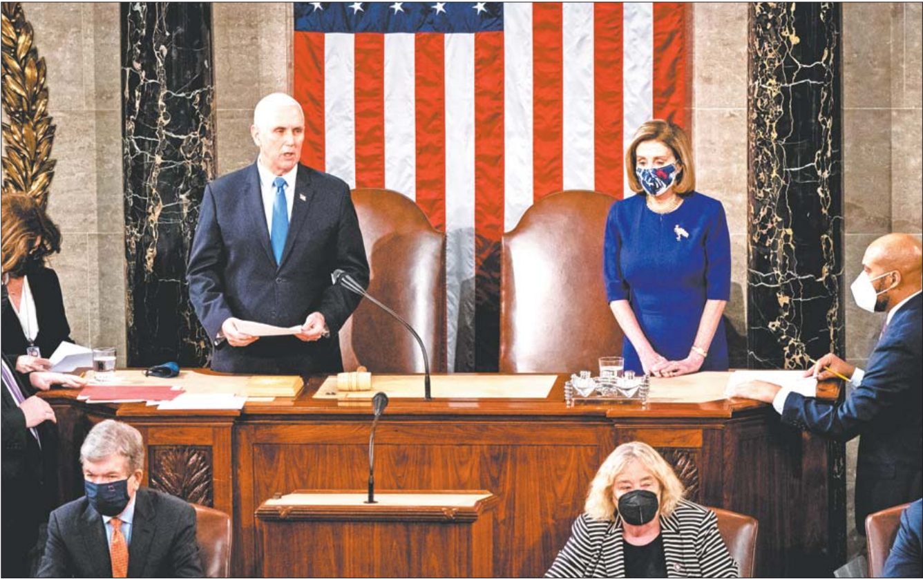
1月6日，副总统彭斯(后排中左)和国会众议院议长佩洛西(后排中右)在国会大厦出席联席会议。

美国国会众议院当地时间12日晚通过一项决议，敦促副总统彭斯动用相关宪法修正案罢免总统特朗普。鉴于彭斯已明确表示拒绝，众议院预计将于当地时间13日启动弹劾程序。当天早些时候，国会众议院公布了准备付诸表决的弹劾案最终版本，弹劾条款指控特朗普“煽动叛乱”，要求对其进行“弹劾和审判，并免除其总统职务，取消其拥有的相关荣誉、信用和有酬职位资格”。