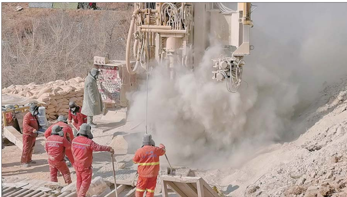
19日,救援现场一处井口正在进行钻井作业。

齐鲁晚报·齐鲁壹点记者从栖霞市笏山金矿事故救援前方获悉,1月19日,应急救援指挥部进一步优化工作思路,明确“3+1”总体救援方案,“3”即:生命维护监测通道(1号和3号钻孔)、生命救援通道(井筒和10号钻孔)、排水保障通道(7号和8号钻孔);“1”即:辅助探测通道(4号、6号和9号钻孔)。目前,救援现场共有10个钻孔,其中2号钻孔因遇破碎带卡钻,5号钻孔因偏离7.3米无法纠偏,均已废弃。