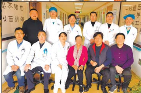
▶患者康复出院时与医护团队合影。