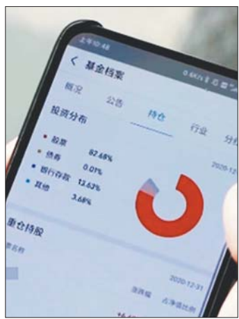
从去年开始投资基金热度不断走高。

此外据了解，对于渠道来说，无论银行、券商还是第三方代销渠道，今年各个渠道的公募销售目标都在大比例增加，年初又是传统“开门红”业绩冲刺的关键阶段，这也在很大程度上助力了爆款频现。