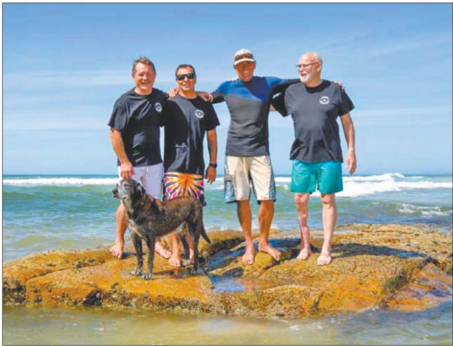
几名“齿痕俱乐部”成员的合影。