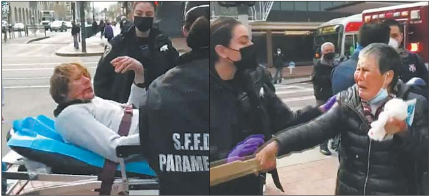
17日,在美国旧金山市街,一位七旬华裔老人遭一名白人男子袭击后奋起反击。(视频截图)

美国反歧视组织“制止仇恨亚太裔美国人组织”当地时间16日发布报告说,在去年3月中旬至今年2月底的近一年时间里,该组织在全美收到了近3800起针对亚裔美国人的种族歧视事件报告。对此,中国外交部发言人赵立坚18日在例行记者会上应询表示,这些丑陋的歧视行为令人感到愤怒和悲哀。