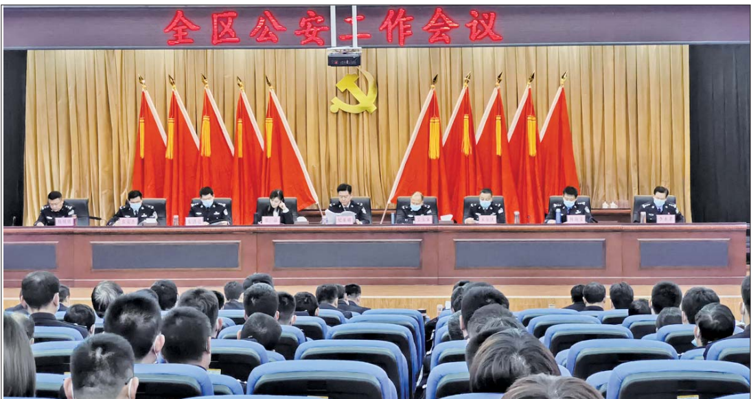
12日下午,区公安分局在交警大队四楼礼堂召开2021年全区公安工作会议。

3月份以来,共计出动532人次,车辆60台次,现场监管建筑渣土处置工地450处次,责令28处工地及时清理污染路面,现场督促8处工地按规定停工,立案查处3起违反规定时间夜间施工行为。