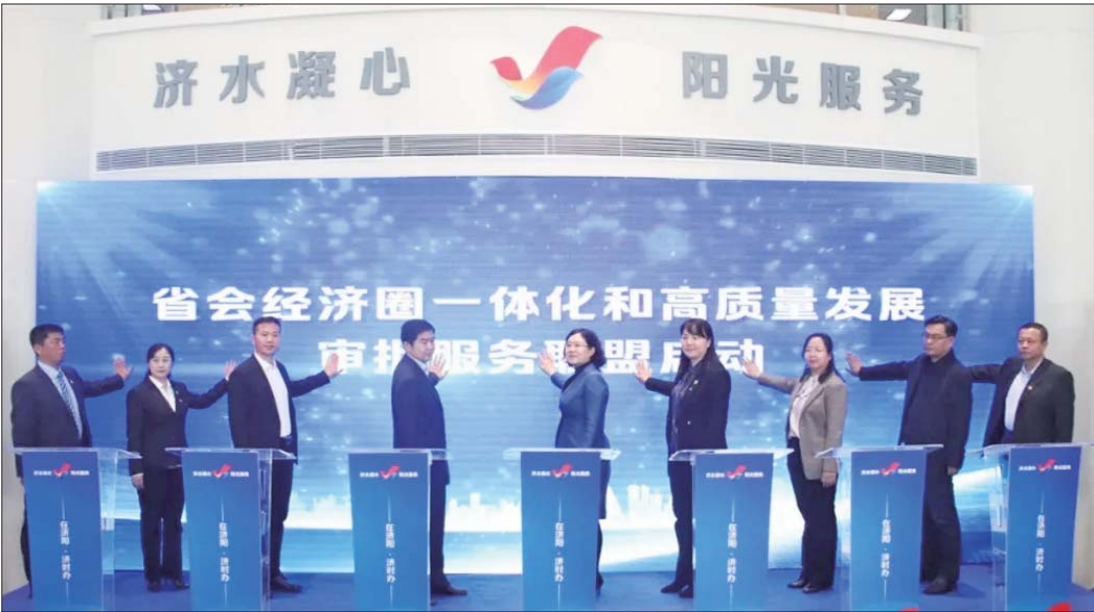
全国首个省会经济圈行政审批服务联盟在济阳区成立。

本报3月18日讯(通讯员 骆颖清) 3月12日,省会经济圈政务服务“全省通办”暨省会经济圈一体化和高质量发展行政审批服务联盟启动仪式在济南市济阳区市民中心举行。济南市济阳区行政审批服务局与淄博市高青县、滨州市沾化区、聊城市高唐县、泰安市宁阳县、德州市德城区、东营市垦利区等省会经济圈6个城市的审批服务管理机构正式签订《省会经济圈政务服务“全省通办”合作协议》,标志着省会经济圈城市企业登记等政务服务事项正式进入“全省通办”新模式。