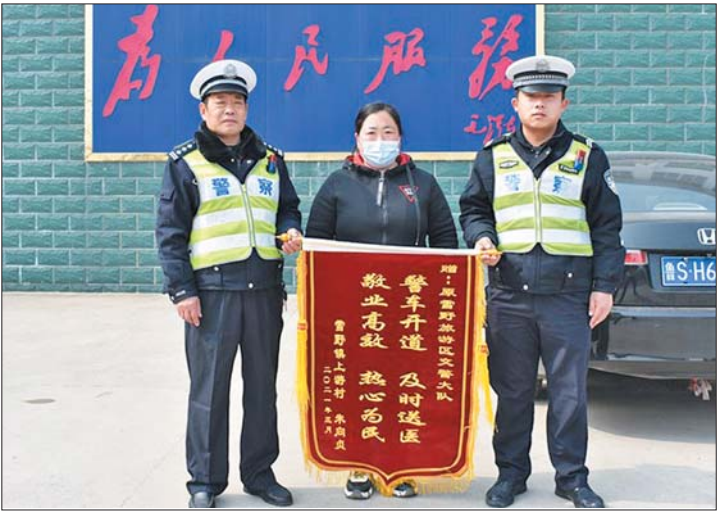
孩子得救,家长送锦旗感谢交警。

本报3月18日讯(记者 亓玉飞 通讯员 张泽文 石刚) 近日,一位青年妇女将一面“警车开道 及时送医 敬业高效 热心为民”的锦旗,送到济南市公安局交警支队莱芜区大队民警手中。她眼含热泪紧握着民警的手说:“谢谢了!俺老百姓不知道说啥好,那天要不是你们出手相助,俺孩子麻烦就大了。” 记者了解到,不久前的一天下午,地处莱芜区北部山区的雪野街道办事处上游村村民朱某某内心十分着急:刚一岁多的孩子不知道什么原因高烧不退,连忙送到当地医院抢救。不巧的是,当地医院的退烧特效药刚刚用完,医生看到孩子已经陷入抽搐状态,再不抢救将会危及生命。听了医生的一席话,孩子的父母急眼了,抱起孩子打了一辆出租车面包车,向济南市人民医院飞奔。 路上,尽管出租车驾驶员技术过硬,但是车来车往的路面,根本提不起速度,照这样下去,怕是耽误孩子抢救。车里的年轻父母心急如焚,不断催促驾驶员加速、加速、加速……,看着挡在前面的车龙,驾驶员也是无可奈何。 行至省道234线155公里处,看到正在执勤的警务人员的身影,驾驶员大喊一声:“孩子有救了,快找警察帮忙。”他下车向执勤民警说明车上的紧急情况。 当时,莱芜区大队警务人