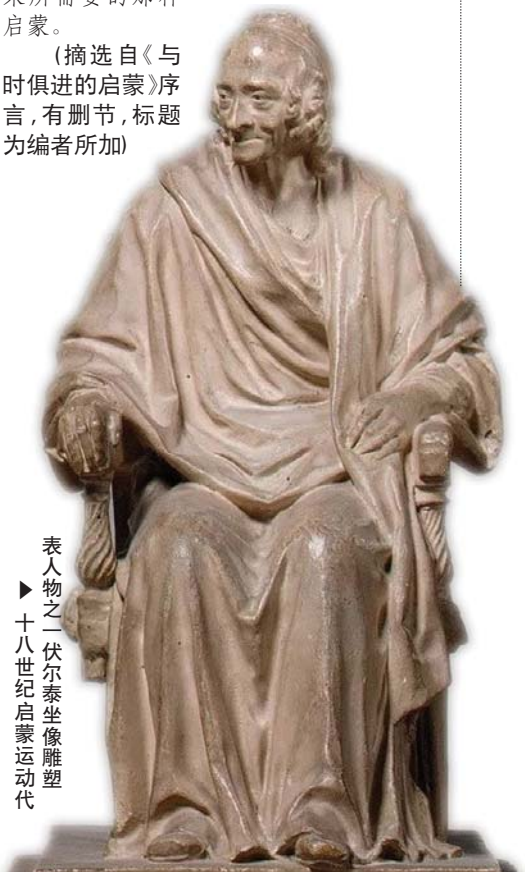
表人物之一伏尔泰坐像雕塑 ►十八世纪启蒙运动代