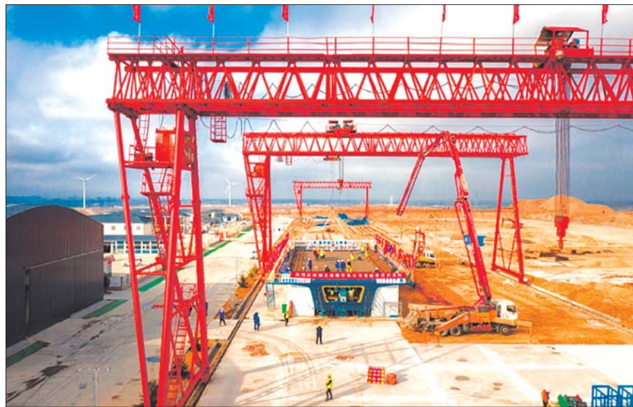
3月27日,北马制梁场内,潍烟铁路(龙口段)首榀箱梁成功浇筑。

本报烟台3月29日讯(记者 梁莹莹 通讯员 于明骏) 两台布料机发出阵阵轰鸣,混凝土从管道中喷涌而下,几十名工人在钢筋骨架上紧张地操作……3月27日,中铁大桥局潍烟铁路3标段项目部北马制梁场内,潍烟铁路(龙口段)首榀箱梁成功浇筑,标志着潍烟铁路(龙口段)的箱梁预制工作拉开序幕,将为接下来的架梁和铺轨施工创造有利条件。