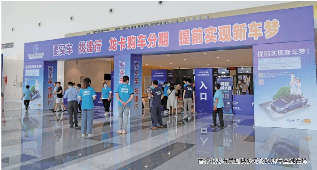
建行将为市民提供多元化的购车金融选择。

龙卡购车分期涵盖主流汽车品牌热销车型,合作汽车厂商贴息,最优惠可获0手续费;办理手续简便,最长60期还款期限;购置税、车险等附加费也享受分期;专业化的团队,专业化的服务。