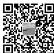
扫描二维码即可报名