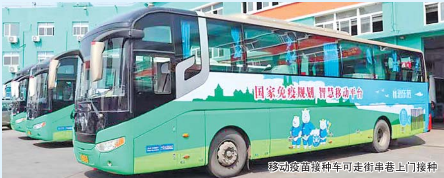
移动疫苗接种车可走街串巷上门接种

日前,移动疫苗接种车陆续亮相北京、上海等大城市街头,为市民上门打疫苗。这些车辆由青岛城运汽车服务集团改造,走街串巷,一次能同时为四人接种。车内配备具有云端数据传输功能的疫苗存储箱,运用5G、大数据等技术,实现疫苗数字化接种管理,保障疫苗信息全流程追溯。