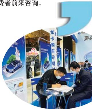
消费者正在办理购车分期。

4月8日—12日,由齐鲁晚报·齐鲁壹点主办的第四十三届齐鲁国际车展,在山东国际会展中心盛大开幕。中国建设银行山东分行作为齐鲁车展的合作银行,携特色业务“建行龙卡购车分期”入驻车展。齐鲁晚报·齐鲁壹点记者看到,在2号厅建行购车分期展位前,吸引了不少消费者前来咨询。