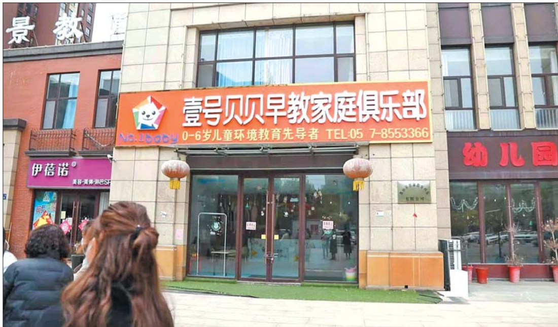
已经关门的壹号贝贝早教家庭俱乐部。

近日,有微山县壹粉向齐鲁壹点情报站反映,多位家长在微山县壹号贝贝早教家庭俱乐部交钱上课,课时还没上完,该早教中心就关门了。家长要求退费,但商家表示课上完了,不能退费。