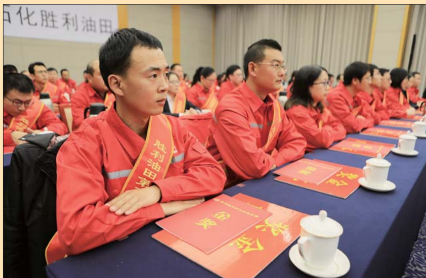
油田召开优秀技能人才表彰会。