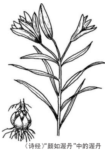
《诗经》“颜如渥丹”中的渥丹

妹多”中一起讨论。《动物卷》按照哺乳类、鸟类、爬行类、两栖类、鱼类、昆虫类的次序编排；《植物卷》按照草本、灌木、藤本、果木、林木的次序编排。这种把相关种类相对集中安排的方式，给读者降低了阅读的门槛。