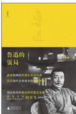
《鲁迅的饭局》 薛林荣 著 广西师范大学出版社

2021年是鲁迅诞辰140周年。出版过《鲁迅草木谱》的薛林荣推出新书《鲁迅的饭局》向鲁迅致敬，该书从鲁迅1921年移居北京到1936年逝世期间参加的重要饭局入手，深挖史料，以小品文的形式，勾勒出鲁迅更真实更立体的文人形象，呈现与鲁迅密切相关的文化大家和文学事件，展开一卷色彩斑斓的民国文坛风情画。