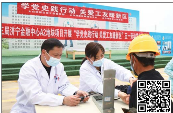
工人正在测量血压。

本次活动由济宁太白湖新区党工委宣传部、太白湖新区融媒体中心、太白湖新区新时代文明实践中心、齐鲁晚报·齐鲁壹点鲁南融媒中心、太白湖新区人民医院联合举办。本次义诊活动,将健康送到工地一线,帮助建筑工人们