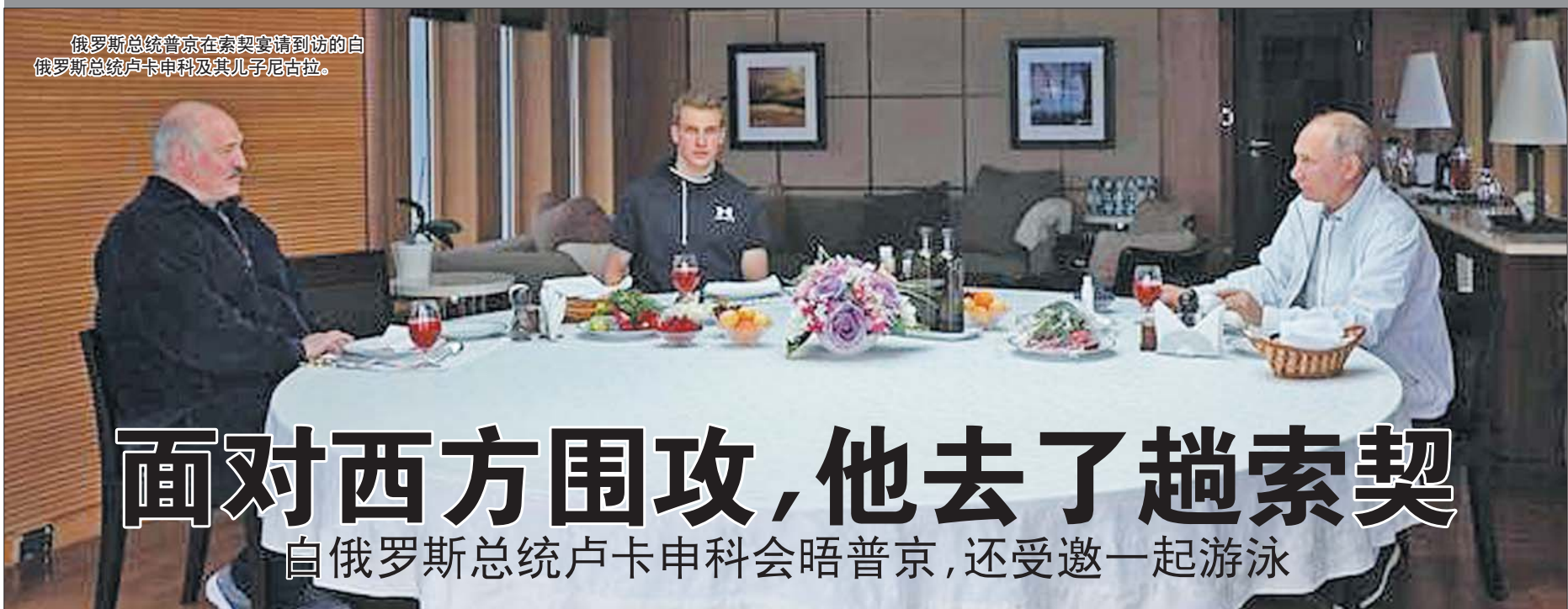
俄罗斯总统普京在索契宴请到访的白俄罗斯总统卢卡申科及其儿子尼古拉。