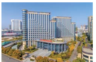
建设临沂市老年养护院的过程中，使用了4500万元省级公益金和4050万元市级公益金。

手工室内，一张长桌、一把剪刀、一桶彩色水笔、几张彩色卡纸，几个老人围坐在一旁，有说有笑地“摆弄”起面前的卡纸……除了手工折纸、涂色游戏之外，这家养护院还开设音乐室、舞蹈室、阅读室等多种功能类型的休闲娱乐场所，并通过每周精心组织观影、品茶、跳舞等形式丰富的休闲活动，共享众人齐乐。