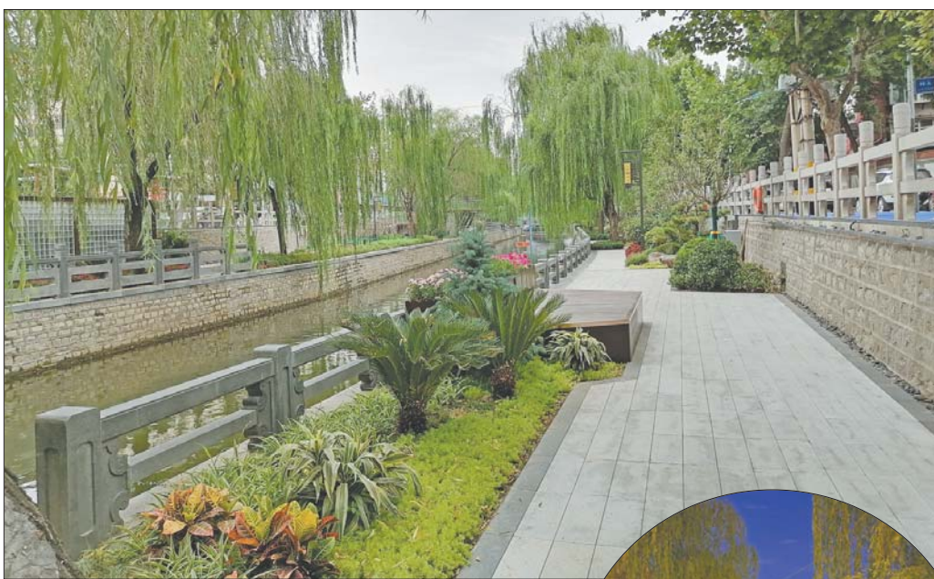
▲改造提升后的工商河景美宜人。

的方案设计上,天桥区广泛征集群众意见,并邀请国内知名设计公司参与方案设计,增加了多处出入口,增设了过河人行天桥,通过对现场反复踏勘,对方案反复推敲,最终确定了本次改造的规划理念“通、绿、亮、水、景、文”。