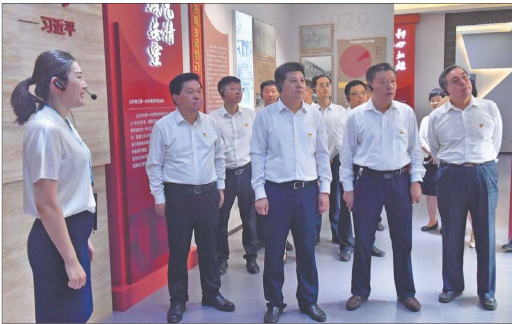
天桥区组织领导干部参观中共济南乡师党史陈列馆新馆。

2008年,小清河开始综合整治,五柳岛景区被规划建设成五柳岛公园。2009年,济南市委、市政府在五柳岛公园内建